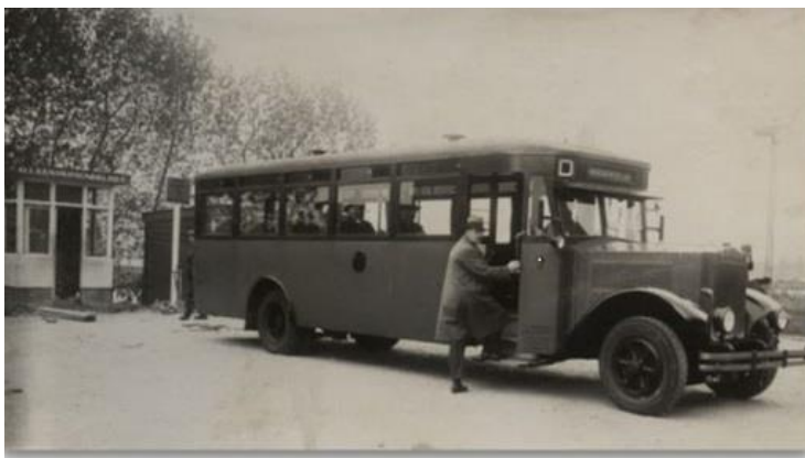
De bus van Gelissen in 1928, tweedehands in Duitsland gekocht.

Voor de niet-dagelijkse zaken moest men naar de stad. Een hele onderneming, omdat er nog geen goede busverbindingen waren. De bus van Gelissen uit Meerssen (station Beek via Adsteeg, Oensel en Ulestraten naar Maastricht) ging maar om de drie uur.