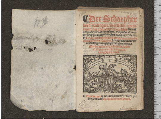
Andere druk van Schaepherders kalengier (1576).