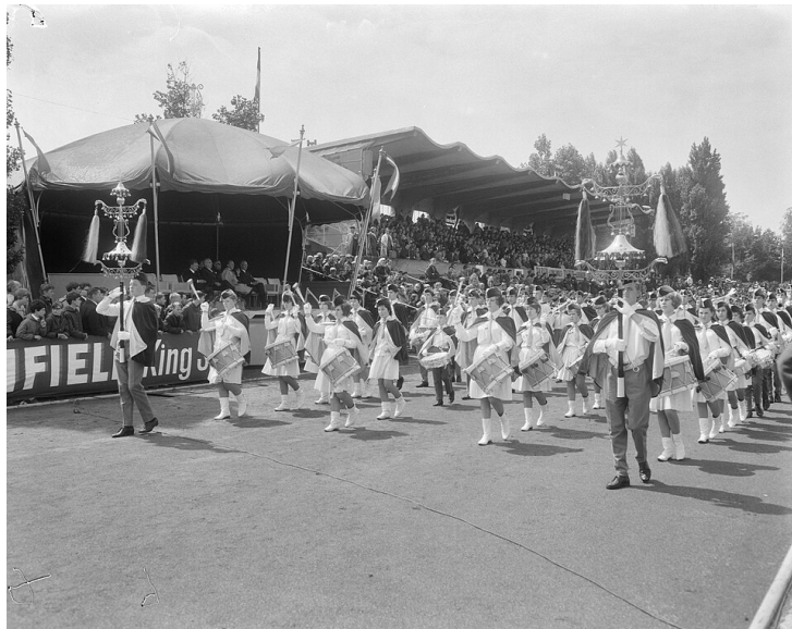
Wereld Muziek Concours Kerkrade, 1966, J. van Bilsen. Van: Wikimedia Commons, Publiek Domein

In deze les onderzoek je hoe blaasmuziek een vaste plek kreeg in Limburg. Je leest over de harmonie van Mheer en bekijkt waarom muziekverenigingen belangrijk waren voor gewone mensen. Daarna onderzoek je een harmonie uit je eigen dorp of stad en vergelijk je die met wat je in het venster hebt gelezen.