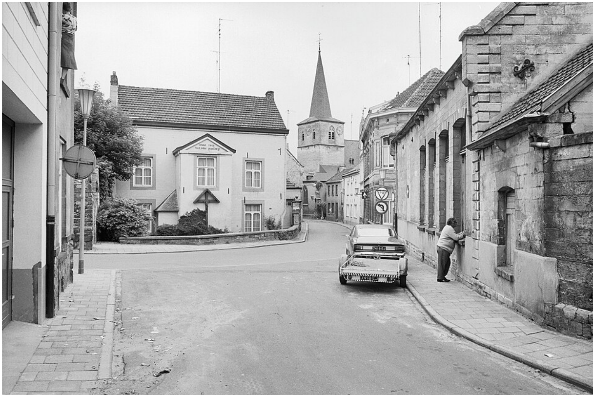
Kerkstraat, Valkenburg. 1976.

In veel dorpen en steden bestaat nog een Kerkstraat, maar staat daar soms geen kerk meer. Onderzoek je eigen woonplaats of een plaats in Limburg: