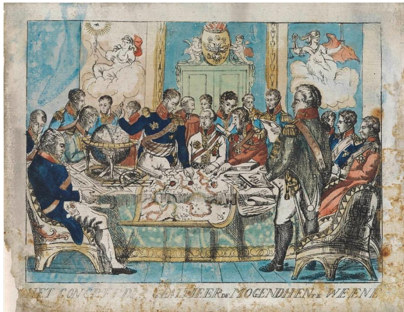
Congres van Wenen, Beraadslagen met de landkaart op tafel tijdens het Congres van Wenen. Prent, 1815. (Rijksmuseum, Amsterdam)

In deze les onderzoek je hoe Limburg na de Franse Tijd onderdeel werd van het Koninkrijk der Nederlanden. Je kijkt naar veranderingen in grenzen, naar verschillen tussen Noord en Zuid, en naar de bijzondere rol van Maastricht. Zo ontdek je waarom de vraag “Is Limburg een provincie van Nederland?” ingewikkelder is dan hij lijkt.