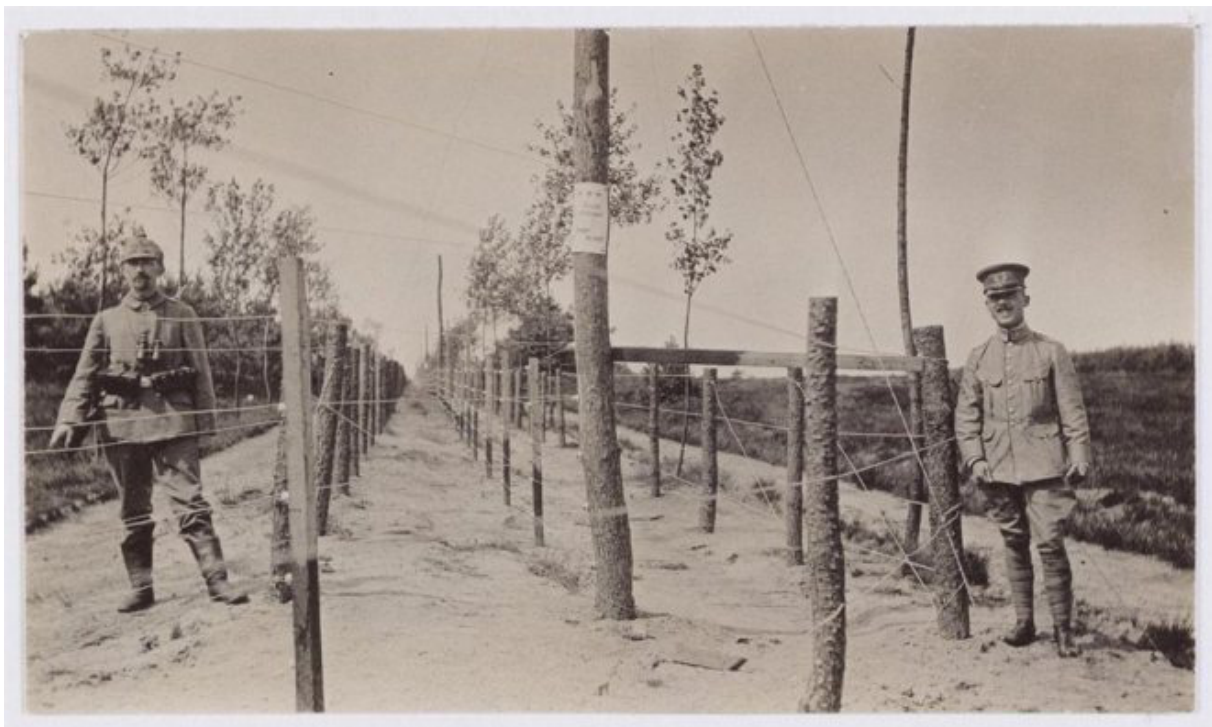
Duitse en Nederlandse grenswacht bij de dodendraad (Molenbeersel) tijdens de Eerste Wereldoorlog (1914-1918).

Voor Limburgse grensgemeenschappen betekende dit dat een vertrouwd landschap opeens dodelijk gevaarlijk was. Boerenland, bospaden, weilanden, alles lag plotseling achter een muur van stroom.