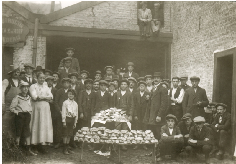
L: Portret van keizer Wilhelm II door hofphotograaf T. H. Voigt van Frankfurt, 1902. R: Foto van Belgische vluchtelingen bij de Firma Van Hoof in de Commandeurslaan in Maastricht, 1914.