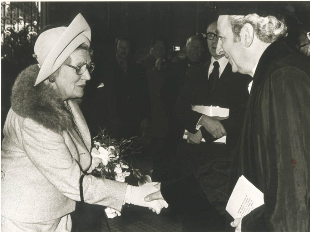
Opening van Rijksuniversiteit Limburg in de Sint Servaaskerk, door koningin Juliana en J. Stockbroekx, 1976. RHCL, Maastricht, ref. nr. 28261. Van Wikimedia Commons, CC-BY 3.0.

In deze les onderzoek je waarom juist Maastricht een universiteit kreeg, hoe onderwijs werd ingezet als oplossing voor maatschappelijke problemen en hoe de universiteit uitgroeide tot een internationale onderwijsinstelling. Zo ontdek je hoe hoger onderwijs niet alleen kennis oplevert, maar ook een regio kan veranderen.