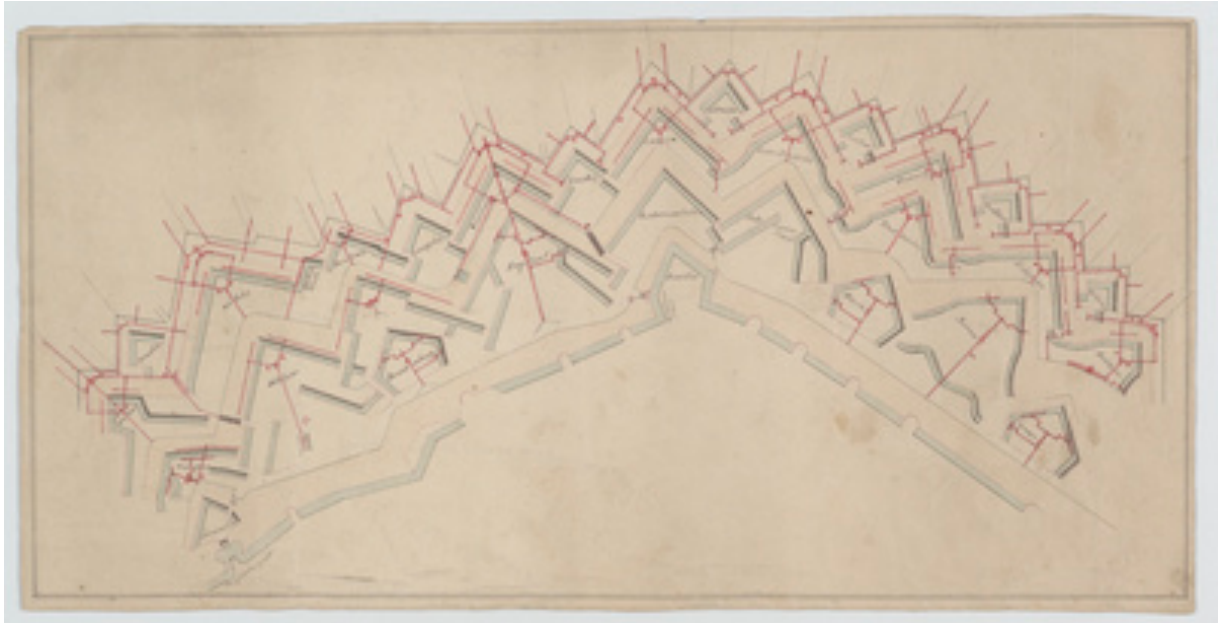
Maastricht. Plattegrond van een deel van de vestingwerken. Plan der mijnen van Bastion Holstein tot Bastion Waldeck. - eind 18e eeuw. Centrum Limburg - CC BY-SA.