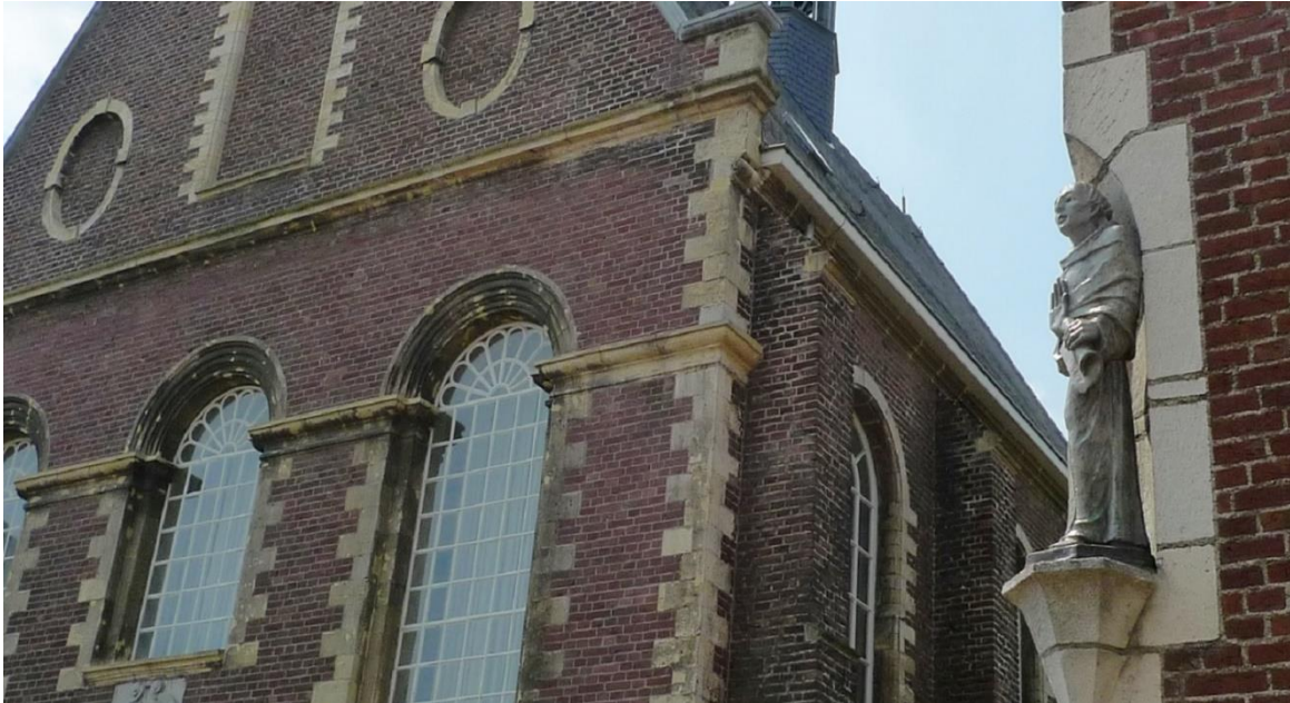
Norbertus van Gennep naast protestantse kerk.

blik naar kerk en samenleving en probeerde haar ten gunste van zijn medemens te veranderen. Zo staat hij ook in Gennep op de Markt afgebeeld. Gericht op de gemeenschap en gekleed in een sobere pij met de regel van Augustinus in de hand. En toevalligerwijs heeft de hervormer Norbertus de oudste protestantse gemeente van Nederland als directe buur!