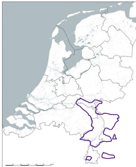
Parochies van het eerste bisdom Roermond (1559-1801). Kaart gemaakt na 1800.