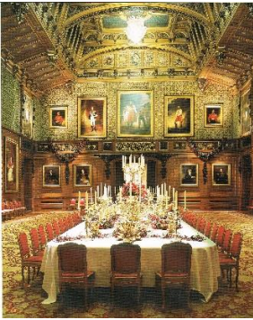
Windsor Castle, Waterloozaal

Wij rijden 's morgens naar Calais (F) en nemen daar de veerboot naar Dover (GB). Via de autosnelweg rijden wij richting het dorpje Downe gelegen op de grens van Kent en Surrey. In Downe staat het woonhuis van de beroemde bioloog en grondlegger van de evolutietheorie Charles Darwin (1809-1882). De familie Darwin woonde in Londen, maar de rumoerige stad met zijn slechte lucht deed Charles Darwin en zijn vrouw besluiten op het platteland te gaan wonen. De keuze viel op het dorp Downe, dat per trein goed verbonden was met Londen. Sedert 1927 is in Down House het Darwin Museum gevestigd. Het museum is gestoffeerd met meubels en gebruiksvoorwerpen van Darwin en natuurlijk is er veel aandacht voor zijn reis met de 'Beagle' (1831-1836) en zijn wetenschappelijke werk.