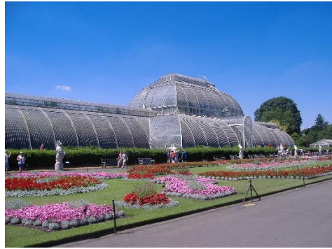
Kew Gardens, Londen