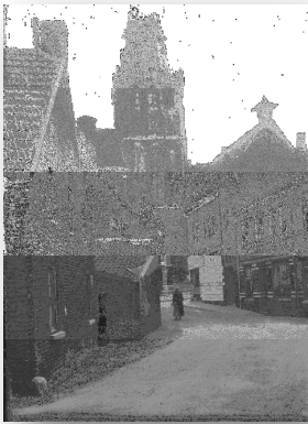
Door bombardementen beschadigde toren van Sint Martinuskerk in 1944. Gezien vanuit de Sint Martinusstraat.