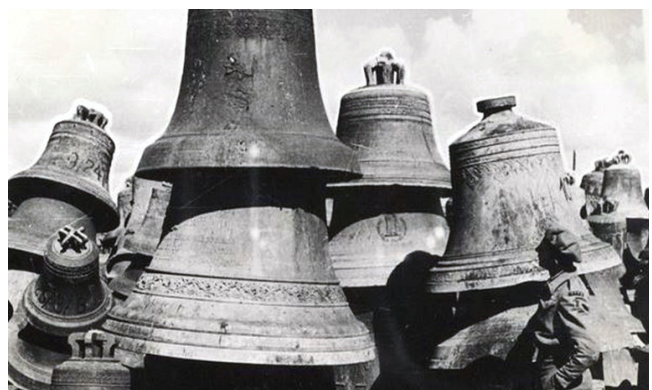
Bemmel 27 november 1943. Zomaar een plaats, zomaar een dag. Maar wel een dag waarop de Duitsers langskomen om de klokken van de Hervormde kerk mee te nemen. Ze mogen nog een dag blijven hangen wegens een huwelijk dat die dag werd gesloten. Direct na het huwelijk werden de klokken definitief geroofd!