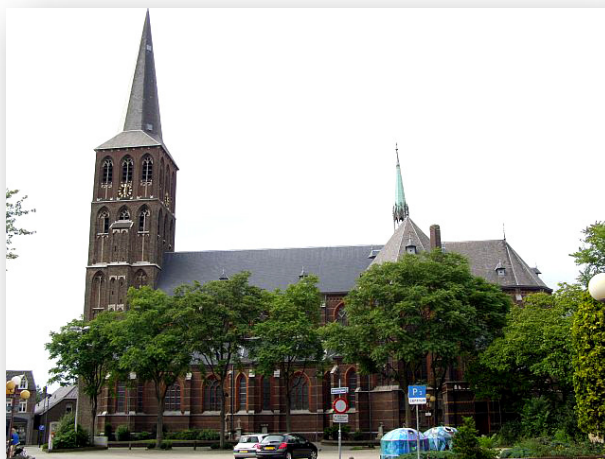
De Tegelse Sint Martinuskerk anno 2018

Bij deze nodigt het LGOG Kring Venlo u uit voor een excursie naar de Sint Martinuskerk in Tegelen. Deze excursie vindt plaats op zaterdag 19 mei 2018.