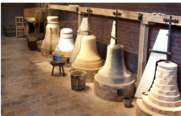
Klokkengieterij in het Maas en Peel Museum in Asten

De klanken van de klokken zijn afgestemd op de aanhef van het Te Deum.