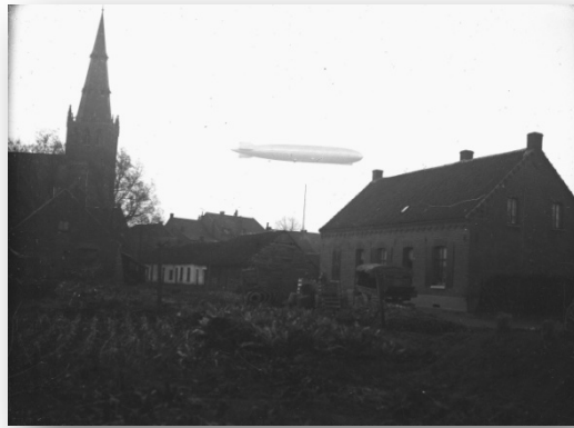
Prachtige foto uit de vroege jaren 30. Links prijkt de torenspits van de Sint Martinuskerk. In het midden zien we een indrukwekkende Zeppelin. Dit speelde zich waarschijnlijk af op dinsdag 11 november 1930.